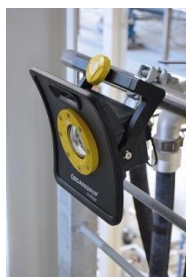
klem bevestiging 03.5609