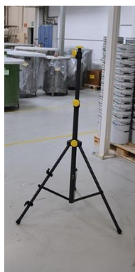
Driepoot statief 03.5607